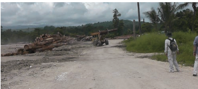
ラノ・ベースキャンプでの違法操業。操業停止命令にもかかわらずフォークリフトが動いていた。2014年11月20日

しかし帰路私たちが、ラノ・ベースキャンプで見たものは、稼働しているフォークリフトであった。判決への違反が行われていた。