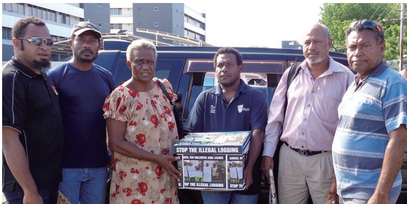
SABLに反対する署名を提出。首都のポートモレスビーで。

「パプアニューギニアとソロモン諸島の森を守る会」の公式ホームページのニュースレターに詳細あり。 http://www.pngforest.com/