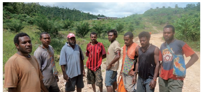
汚染された泉とオイル・パーム・プランテーション化された地域