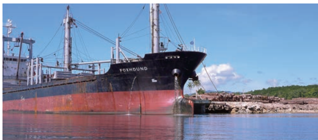
昼夜を問わない伐採と丸太輸出