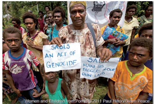
「SABLは集団虐殺」「私たちを自分の土地での物乞い人に貶めるSABL」と手作りポスターで訴える女性たち

調査委員会は不正契約の事実を報告するも、政府からは何の反応もない。他のSABL地域でも住民からの反対があがるが、同様であった。あちこちでSABL問題の裁判が起こり今に至る。