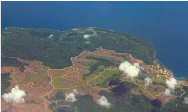
上空からのムー村奥地。森を裸にされ、オイル・パーム・プランテーション化が進む。2013年