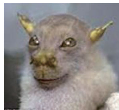
ナカナイ山系で最近発見された新種のオオコウモリ

ナカナイ山系の樹海。世界一大きいと言われる洞窟もあり、多様で貴重な動植物の宝庫である。森は海の恋人、この海辺に夜小舟を繰り出すと、波間に光る無数の魚たちに出会う。満天の星のように海流に乗って、その光は延々と続く。