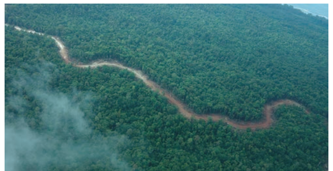
上空からのボマタ地域の原生林を縫う伐採道路。2013年11月4日