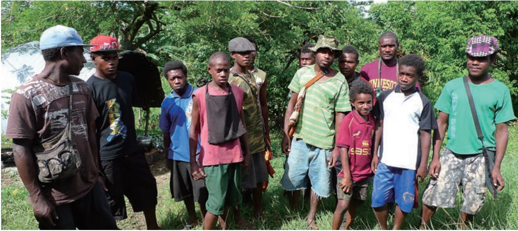
バイラマン河沿いの自分たちの森から伐採ブルドーザーを追い出した青年と子どもたち。ギルフォード社は子どもたちさえも拘束し、ラバウルの裁判所へ出頭させていた。2013年11月8日